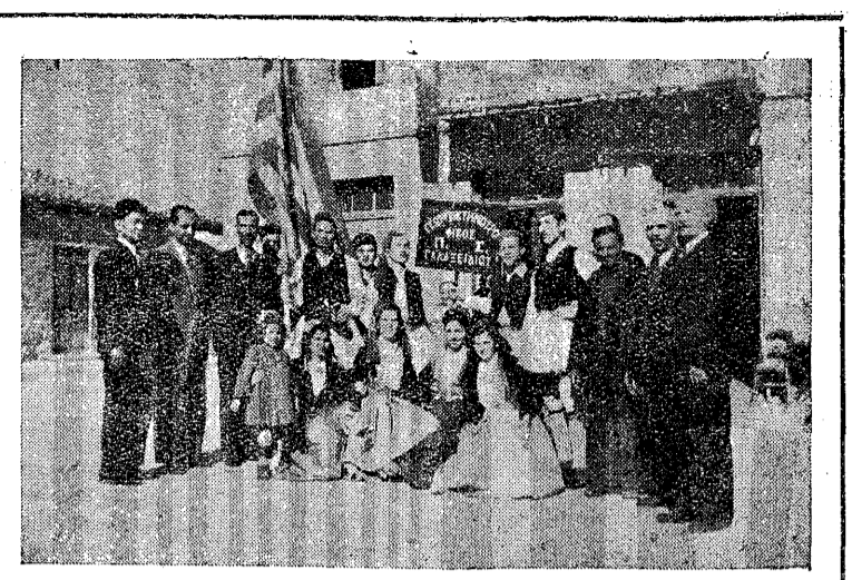
Κατὰ τὴν ἡμέραν τῆς «Ἐθνικῆς Ἑβδομάδος τοῦ ἀγροῦ» ὁ Γαιοκτηνοτροφικὸς Συνεταιρισμὸς Γαλαξειδίου ἀγαγορεῖ εἰς Ἀμφισσαν νὰ συνορατῆ τὴν ἡμέραν με τὰς ἄλλας γεωργικὰς ὀργανώσεῖς του Νομοῦ.

—Ἐπίσης εὐεργετικὰ ὑπῆρξαν διὰ τὰ νεοφυτευθέντα ὑπὸ τῶν σχολείων μας δεινδρύλλια εἰς τὸ ἄλσος, τὰ ὁποῖα ἐπὶ ἀρκετὰς ἡμέρας ἐποτίσθησαν.