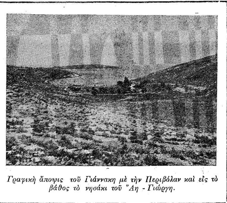
Γραφική άποψις του Γιάννακη με την Περιβόλαν και εις τό βάθος τό νησάκι του 'Αη - Γιώργη.