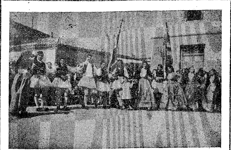
Κορίτσια καὶ ἀγόρια τοῦ Γαλαξειδιοῦ χοροῦν κατὰ τὴν ἔθνικὴν μας ἐπέτειον τῆς 25ης Μαρτίου.