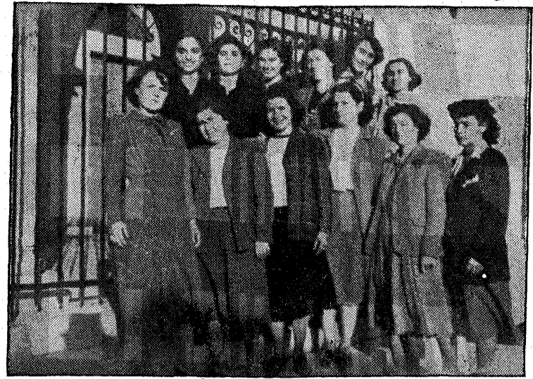
Η λαμπρά χοροδία τῶν καλῶν κοριτσιῶν της πατρίδος μας, ή όποία άποτελεῖ άληθινόν κόσμημα του Ιερού ναῦ του 'Αγίου Νικολάου κατά τὰς έορτάς