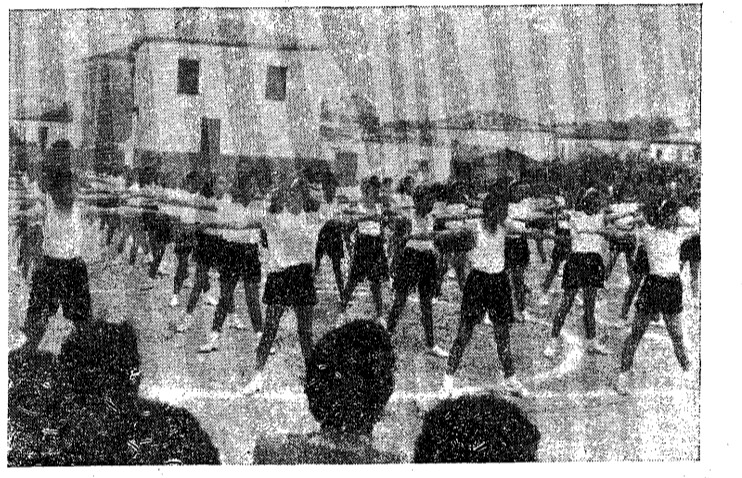
'Από τάς γυμναστικάς επιδείξεις του Δημοτικού Σχολείου.

ΓΑΛΑΞΕΙΔΙ, 'Ιούνιος. — 'Όπως κάθε χρόνο και έφέτος επί τη λήξει των μαθημάτων του Δημοτικού μας Σχολείου έτελέσθησαν την 21ην π. μηνός Μαΐου εις τον πρό του Δημοτικού μας Σχολείου χώρον αι