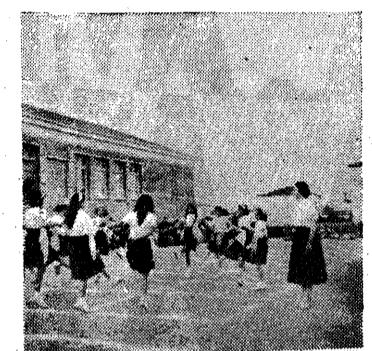
Από τίς γυμναστικές επιδείξεις των σχολείων μας.