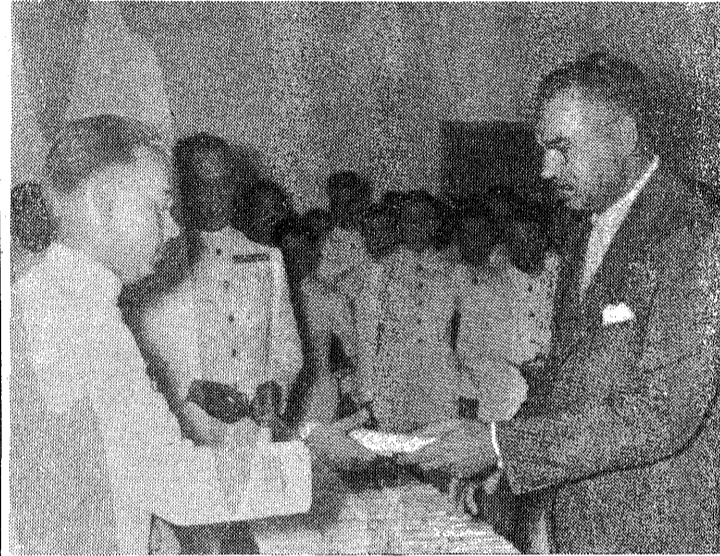
Ὁ Ὑπουργὸς τῆς Ἐμπορικῆς Ναυτιλίας κ. Γ. Ἀνδριανόπουλος ἐπιδίδων τὸ δίπλωμα εἰς τὸν συμπολίτην κ. Ἐβένου Ἐμπερτοῦ. Εἰς τὸ μέσον οὐραίου τῆς Σχολῆς Ἀσπροπύργου, ἀντιπλοίαρχος Λιμενικοῦ, κ. Ν. Βλαδίμηρος.

Ἀκολούθως ὁ Ὑπουργὸς τῆς Ἐμπορ. Ναυτιλίας κ. Γ. Ἀνδριανόπουλος εἰς ἐμπνευσμένον λόγον τοῦ