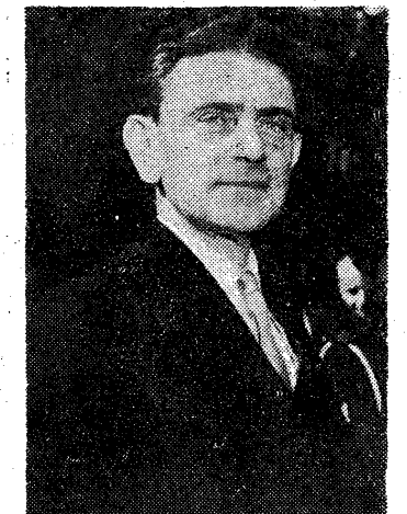
ΔΙΑ ΤΗΝ ΣΥΝΔΕΣΜ. ΣΤΕΓΗΝ

ΕΥΓΕΝΗΣ ΠΡΟΣΦΟΡΑ ΤΗΣ Ε. ΒΛΑΣΣΟΠΟΥΛΟΥ - ΣΑΒΑ