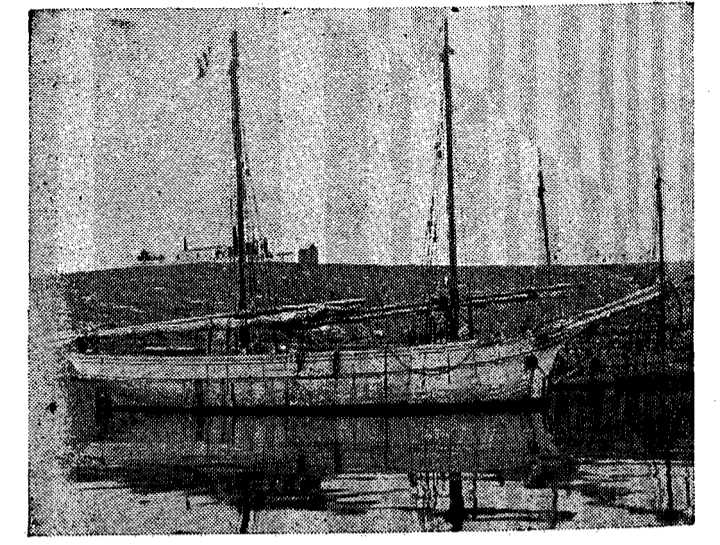
Τὸ πρώτο σκαρὶ τοῦ Παπαπέτρου.