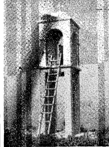
Τὸ καμπαναριὸ τοῦ ἐξωκκλησίου ὁ Ἅγιος Ἀθανάσιος

2) Νὰ πληρῶσετε ὅλοι ὅπως πληρῶνουν ὅλοι εἰς τὸ ἐσωτερικόν, καὶ ἐκεῖνοι οἱ ὁποῖοι λόγω δικαιολογημένα πολυτίμων ὑπηρεσιῶν τῶν πρὸς τὸν Σύνδεσμον δὲν