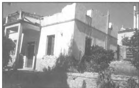
Ότι απέμεινε μετά την κατεδάφιση από το αρχοντικό του αείμνηστου ιατρού και Δημάρχου Γαλαξειδίου Ευθυμίου Βλάμη

Ο τ. Δήμαρχος και Δ. Σύμβουλος κ. Ν. Γουργουρή έθεσε μεταξύ άλλων τα θέματα της παράνομης κατεδάφισης της ιστορικής οικίας Ν. Βλάμη και του περιορισμού της στάθμευσης των αυτοκινήτων στην παραλία κατά τις ώρες αιχμής.