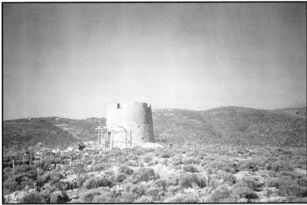
Ο παλιός Μύλος. Απόκτημα του παραδοσιακού οικισμού, που αποκατάσταθηκε με ιδιωτική πρωτοβουλία.

αιγίδα του ΥΠΠΟ στην Αθήνα 7-9 Μαΐου η πρώτη επιστημονική Συνάντηση με θέμα «Προβλήματα έρευνας και τεκμηρίωσης των ελληνικών Μύλων».