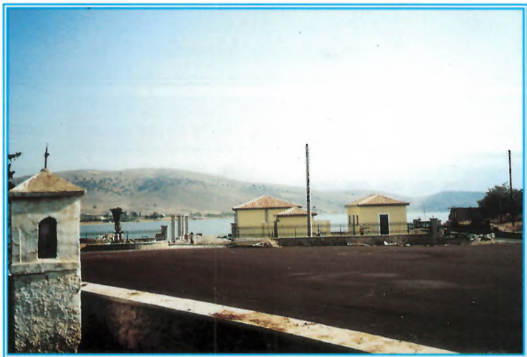
Η πλαζ Καλαφάτη. Σε λίγες μέρες θα τεθεί στη διάθεση των συμπολιτών μας και των παραθεριστών.

Ο Άγιος Βασίλειος είναι ένας πολύ όμορφος κολπίσκος με καθαρά και ολογάλανα νερά, που δεν απέχει περισσότερο από 3-4 χιλιόμετρα από το Γαλαξειδί. Η πρωτοβουλία του Δημάρχου να καθαρίσει τον περιβάλλοντα χώρο και να εξασφαλίσει ανεκτίμητη βατότητα στον υπάρχοντα αγροτικό δρόμο θα συμβάλει αποτελεσματικά ώστε ο "Αν Βασίλης" ν' αναδειχθεί σε μία από τις καλύτερες πλάζ της πόλης μας, που τόσο της λείπουν. Αν ο Δήμαρχος κατορθώσει επιπλέον να πείσει τη Σχολή Τουριστικών Επαγγελματιών τουλάχιστον, το καλοκαίρι που είναι κλειστή, να ανοίξει την πόρτα της κεντρικής εισόδου και να επιτρέψει τη διέοδο των οχημάτων προς τον "Βόιδικα", τότε άλλη μια πολύ ωραία πλάζ θα τεθεί στη διάθεση των λουμένων.