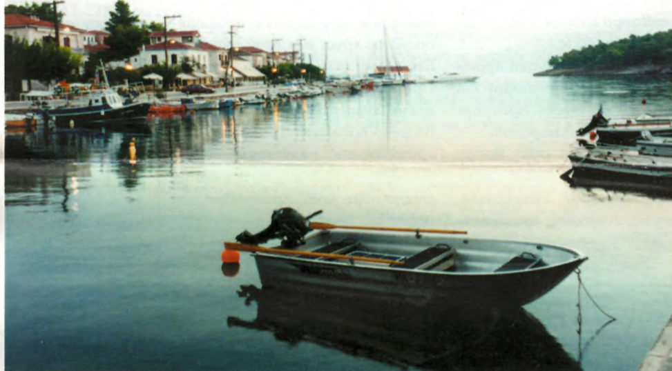
Καλοκαίρι, χάραμα στο Γαλαξείδι. Ώρα 5 το πρωί. (Φώτο και λεζάντα Κώστα Κατοσανάκη).

Η προσφυγή θα εκδικασθεί στις 25 Νοεμβρίου του 2002 από το Εκλογοδικείο Λειβαδιάς κι η απόφαση, εκτιμάται ότι θα εκδοθεί στις αρχές Δεκεμβρίου.