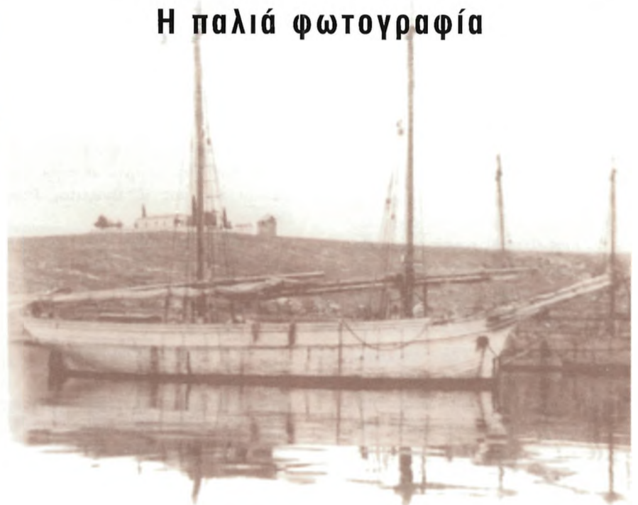
Φωτογραφία του 1902.

Των Αγ. Αναργύρων, γιόρτασε όπως κάθε χρόνο το γραφικό εκκλησάκι της οικογένειας Αργ. Κοκκόρη στους Αγ. Πάντες. Στιγμιότυπο από την πανήγυρη.