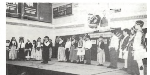
Οι μαθητές των Ημερησίων Σχολείων της Νέας Υόρκης γιόρτασαν με μεγαλοπρέπεια την επέτειο της 28ης Οκτωβρίου. Με τα πατριωτικά τους ποιήματα και τραγούδια, καθώς επίσης και με τα μονόπρακτα, απέδειξαν ότι όχι μόνο διδάσκονται την ελληνική γλώσσα, αλλά και ότι είναι αποφασισμένοι να ακολουθήσουν το παράδειγμα των προγόνων τους.