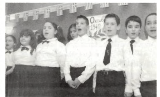
Μαθητές του Δημοτικού Σχολείου Αγ. Δημητρίου Αστόριας γιόρτασαν την επέτειο της 28ης Οκτωβρίου.