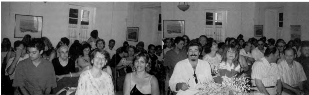
Από την απόδοση επαινών στους νεοεισαχθέντες στα ΑΕΙ - ΤΕΙ στο "Σπίτι των Νέων".