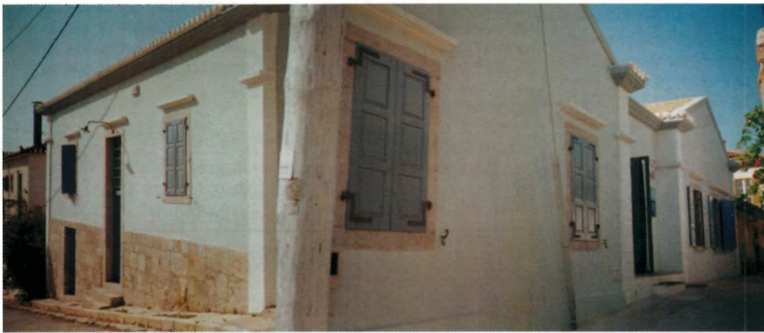
Το Ναυτικό και Ιστορικό Μουσείο Γαλαξειδίου μετά την ριζική ανακαίνιση του παραδοσιακού κτιρίου.

Μετά από δύομισι χρόνια γενικής επισκευής και επέκτασης άνοιξε τις πόρτες του την Κυριακή 27/06/03 το Ναυτικό και Ιστορικό Μουσείο Γαλαξειδίου , για τους συμπολίτες μας και για τους πρώτους επισκέπτες της θερινής