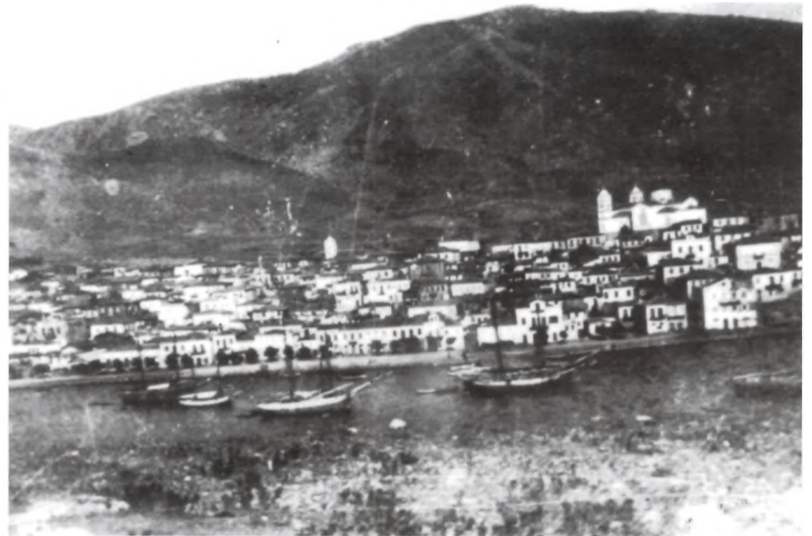
Το κεντρικό λιμάνι του Γαλαξειδίου με Γαλαξειδιώτικα καράβια στα τέλη του 19ου αιώνα.