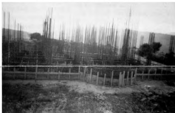
Η έναρξη οικοδομικών εργασιών στο Ίδρυμα της Παναγίας

1. Το Σωματείο ιδρύθηκε στο Γαλαξειδί το 1991, με κύριο στόχο την ανέγερση ενός Ιερού Καθιδρύματος μέσω του οποίου θα υλοποιούνται οι πνευματικοί και κοινωνικοί σκοποί του. Με τη σταδιακή απόκτηση περιουσίας, δημιουργούνται οι προϋποθέσεις για μετατροπή του Σωματείου σε Ίδρυμα , κάτι που σκοπεύουμε να κάνουμε με τη λήξη της θητείας του νέου Διοικητικού Συμβουλίου και ύστερα από απόφαση της Γενικής Συνέλευσης των μελών του Σωματείου.