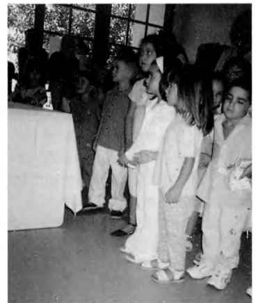
Αγιασμός στο νηπιαγωγείο του Γαλαξειδίου για τη σχολική χρονιά 2003-04.