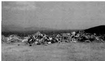
Ανεμοκάμπι. Εικόνα τριζομοική.