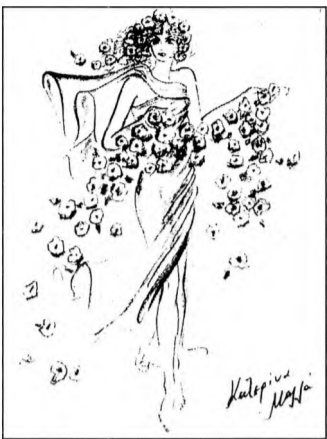
Έργο της ζωγράφου Κατερίνας Μαλλιά.

Άψογοι οι οικοδεσπότες ο Τόλης και η Κατερίνα Μαλλιά με τα παιδιά τους Άννα-Μαρία και Γιώργο, ξενάγησαν τους επισκέπτες στον εκθεσιακό χώρο και