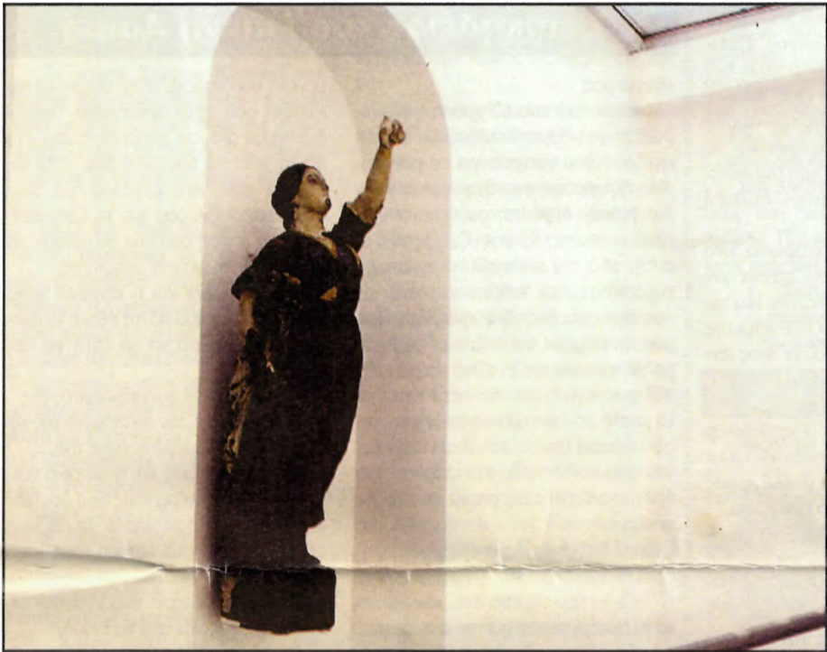
Άθουσα του Ναυτικού και Ιστορικού Μουσείου Γαλαξειδίου.

Κ αλά και παρήγορα τα νέα για το "Ναυτικό και Ιστορικό Μουσείο Γαλαξειδίου".