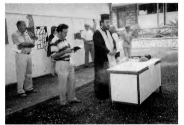
Απ' τον Αγιασμό στα σχολεία Γυμνασίου Λύκειο για τη σχολική χρονιά 2003-04.