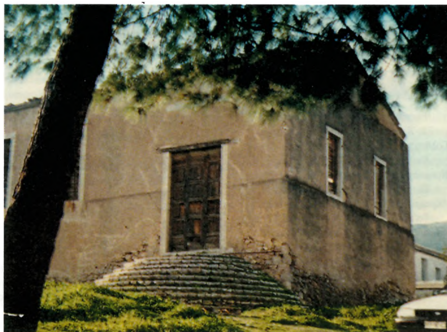
"Καποδιστριακό Σχολείο"