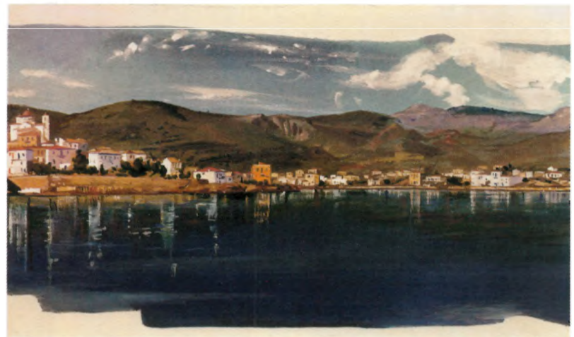
Ο Άγιος Νικόλαος και το λιμάνι του Χειρόλακα. Τέμπερα του Σπύρου Βασιλείου