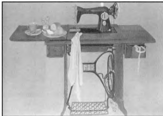
Ραπτομηχανή (έργο του Σπ. Βασιλείου)

του καθενός που θέλει να ευρύνει τους εκφραστικούς του χώρους και ομολογώ πως πολλές φορές με πλάνευαν στολίδια και παιχνιδίσματα, κι' άλλοτε έσφιγγε η ψυχή μου με την μιζέρια και την αθλιότητα που σώρευαν σύγχρονοι καλλιτέχνες σε χώρους αποπνικτικούς. Αρνιέμαι όμως να παραδεχτώ πως σώνει και καλά πρέπει να στερηθούμε την πρωταρχική χαρά να βλέπουμε και να πασκιζουμε να κάνουμε και τους άλλους κοινωνούς της ματιάς μας, χαράζοντας έστω με το ορμέμευτο του παιδιού ή τη σοφιστεία του Μίτο έναν κύκλο