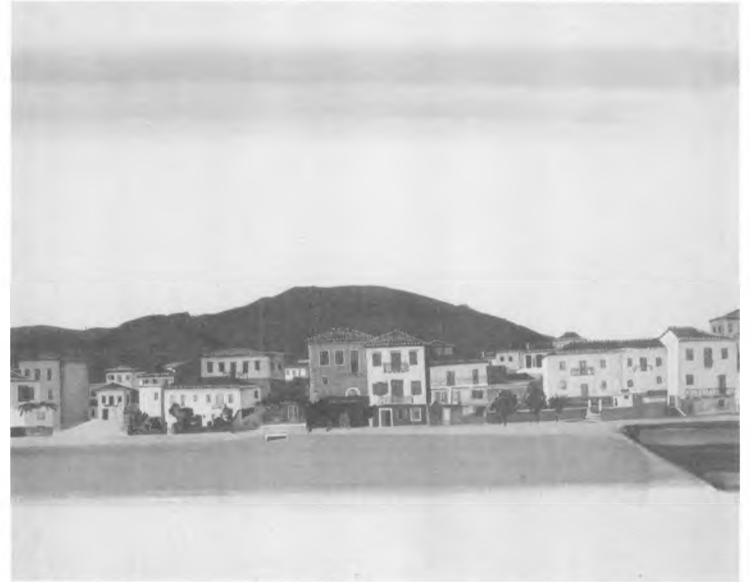
Ο χειρόλακας - Γαλαξειδί (Τέμπερα. Σπ. Βασιλείου)

Σ' αυτό το βιβλίο, «καταθέτουν» με τα κείμενά τους γνωστοί άνθρωποι της τέχνης και των γραμμάτων και ο Μπάρμπα Σπύρος «απολογείται» όπως λέει στο πρώτο πρόσωπο «ενώπιον του μεγάλου κοινού των φίλων ομοτέχνων και του σοβαρού κριτηρίου». Ας αφήσουμε λοιπόν τον ίδιο, να μας πει την ιστορία του με το γλαφυρό και ποιητικό τρόπο που ξέρει να χρωματίζει τα κείμενα, όπως κάνει με τις όμορφες ζωγραφιές του.