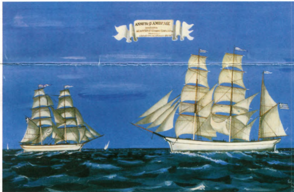
"Ανέτα και Άμπελος." Έργο του Σπύρου Βασιλείου. (Βρίσκεται στο "Ναυτικό και Ιστορικό Μουσείο Γαλαξειδίου.")

Η Δημοτική Επιχείρηση Μεταφοράς & Διάθεσης Βοθρολυμάτων Αποχέτευσης Γαλαξειδίου (Δ.Ε.Μ.Δ.Β.Α.Γ.) πραγματοποιεί το πρόγραμμα