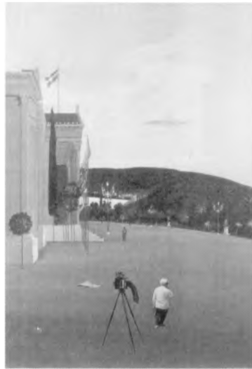
“Αθήνα” ή “ο φωτογράφος του Ζαπτείου” (Ελαιογραφία. Σπ. Βασιλείου)