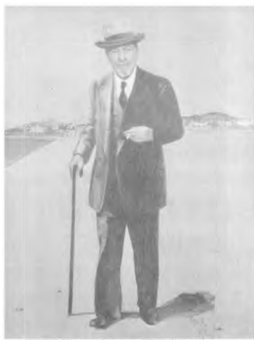
“Ο δάσκαλος” (έργο του Σπύρου Βασιλείου)

Ο Γαλαξειδιώτης ζωγράφος Σπύρος Βασιλείου. Εκατό χρόνια από τη γέννησή του