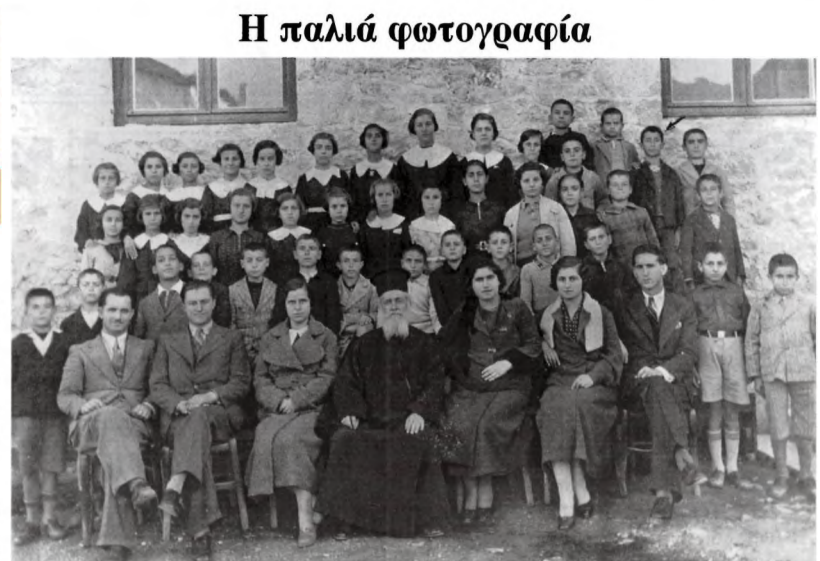
ΣΤ' Δημοτικού Σχολείου Γαλαξειδίου, Παρασκευή 28η Νοεμβρίου 1936

Από το πολιτικό Γραφείο του Ι. Δ. Μπούγα