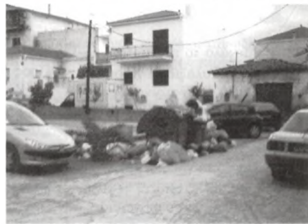
Βοννά τα σκουπίδια το Δεκαπενταύγουστο.