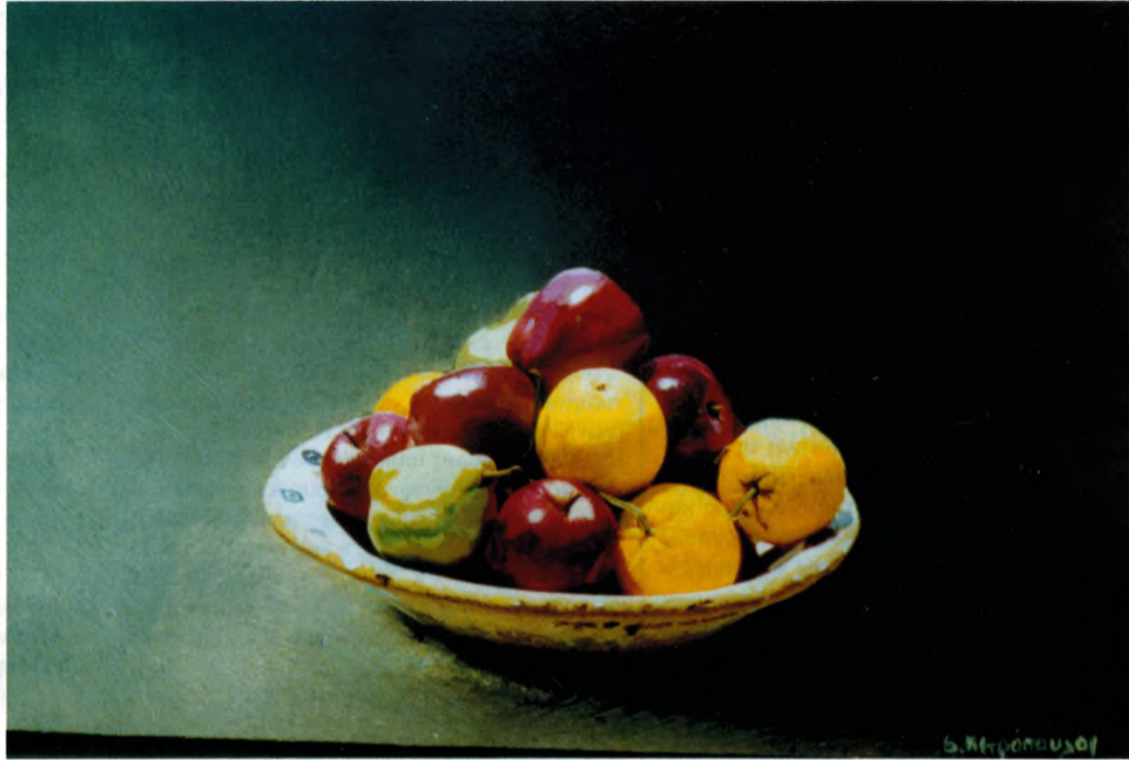
Έργο του Στάθη Πετρόπουλου. Ο ζωγράφος εκθέτει στην "Αίθουσα Τέχνης Ναυπλίου" από 20/11 έως 5/12/2004

"Ο Σύνδεσμος Γαλαξειδιωτών" με την έναρξη του Χειμώνα, αποφάσισε να πραγματοποιήσει συνεστίαση στο κεντρικό ξενοδοχείο των Αθηνών "ΑΜΑΛΙΑ" στο Σύνταγμα, το βράδυ της 3ης Δεκεμβρίου, ημέρα Παρασκευή.