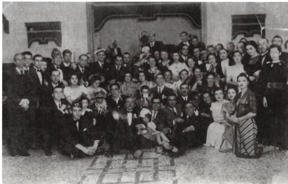
"Χοροεσπερίς" του Συνδέσμου Γαλαξειδιωτών στο φουαγιέ του Δημοτικού Θεάτρου Πειραιώς