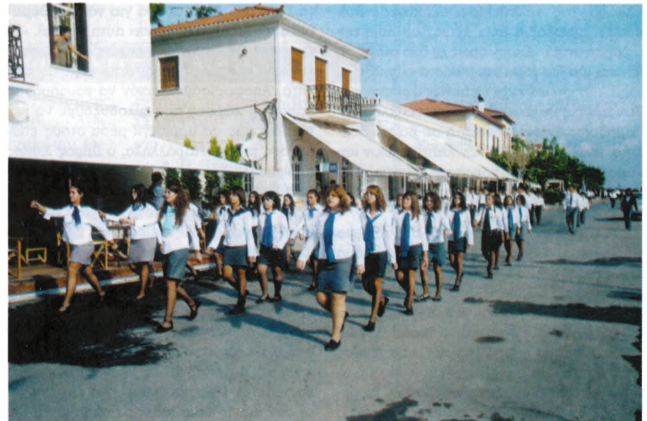
Από την παρέλαση των μαθητών Λυκείου-Γυμνασίου Γαλαξειδίου για την επέτειο της 28ης Οκτωβρίου, (Φωτο: Ηλία Μασάρου)