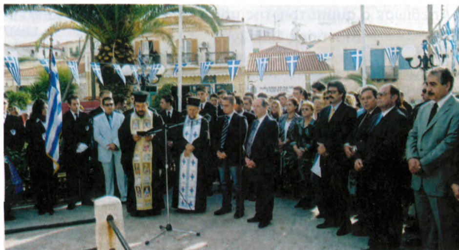
Επιμνημόσυνη δέηση και κατάθεση στεφάνων στην Πλατεία Ηρώων.