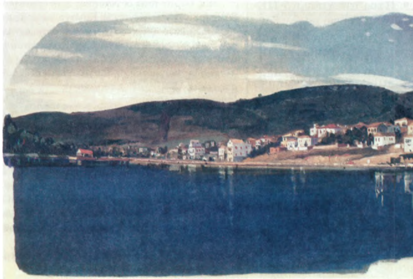
Το Γαλαξειδί από τη θάλασσα, με τα όμορφα χρώματα του μεγάλου Γαλαξειδιώτη ζωγράφου Σπύρου Βασιλείου.

Ο Σύνδεσμος Γαλαξειδιωτών και «Το Γαλαξειδί» εύχεται στους αναγνώστες και φίλους του Γαλαξειδιού καλά και ειρηνικά Χριστούγεννα