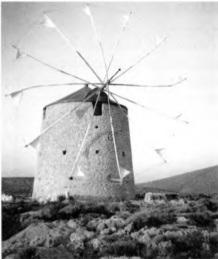
Ο Ανεμόμυλος όπως είναι σήμερα.

Οι εργασίες αποκατάστασης του Ανεμόμυλου ολοκληρώνονται με την τοποθέτηση Αλεξικέραυνου για την προστασία του και τη διαμόρφωση του χώρου στον οποίο θα πραγματοποιούνται πολιτιστικές εκδηλώσεις (μουσικές-χορευτικές-θεατρικές). Με την ευκαιρία αυτή θέλουμε να ευχαριστήσουμε όλους όσους βοήθησαν το έργο αποκατάστασης, καθώς επίσης και τους συμπολίτες μας που βοήθησαν το έργο αφιλοκερδώς.