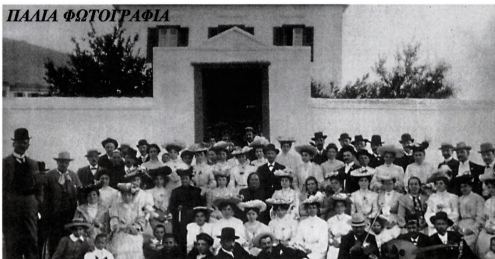
Αραβάνες στο Γαλαξειδί, το 1906. Τότε που ο αραβάνας δεν ήταν μια τυπική «αμοιβαία υπόσχεσι γάμου», αλλά ένα ιδιαίτερο και ξεχωριστό γεγονός. Η φωτογραφία ανήκει στον Ισ. Π. Σιδηρόπουλο. (Από το βιβλίο του Αν. Σκιαδά "Το Γαλαξειδί. Μια πανάρχαια πολιτεία"). Μια σπάνια φωτογραφία που απεικονίζει την αρχοντιά της γαλαξειδιώτικης κοινωνίας στις αρχές του περασμένου αιώνα.