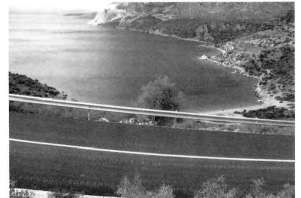
Φωτογραφίες από τον πρόσφατα ασφαλτοστρωμένο δρόμο που οδηγεί στην παραλία του Αγ. Βασιλείου.