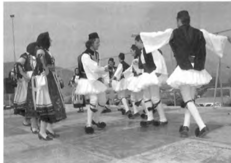
Στιγμιότυπο από τα υπέροχα χορευτικά της Καρδίτσας.