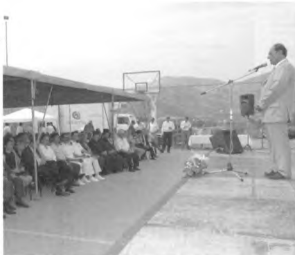
Ομιλία του Δημάρχου Γαλαξειδίου στο γήπεδο της Σχολής Τ.Ε.

Στη φωτο ο τ. Υπουργός Ν. Γκελεστάθης, ο Υφυπουργός Καλογιάννης, ο Δήμαρχος Ν. Γουργουρή, ο βουλευτής Ι. Μπούγας, ο Δήμαρχος Αμφισσας Ν. Φουσέκης και ο τ. Πρόεδρος του διαμ. Αγ. Πάντων Γ. Σουλάντζος.