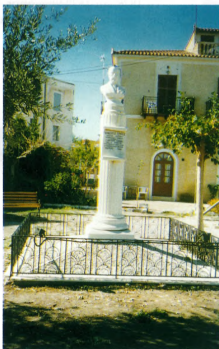
Το άγαλμα του Γεράσιμου Ζωχιού στην πλατεία του Χηρόλακα στο Γαλαξειδί.

Επισκεφθείτε το “Ναυτικό και Ιστορικό Μουσείο Γαλαξειδίου” την κιβωτό της ναυτοσύνης του Γαλαξειδίου