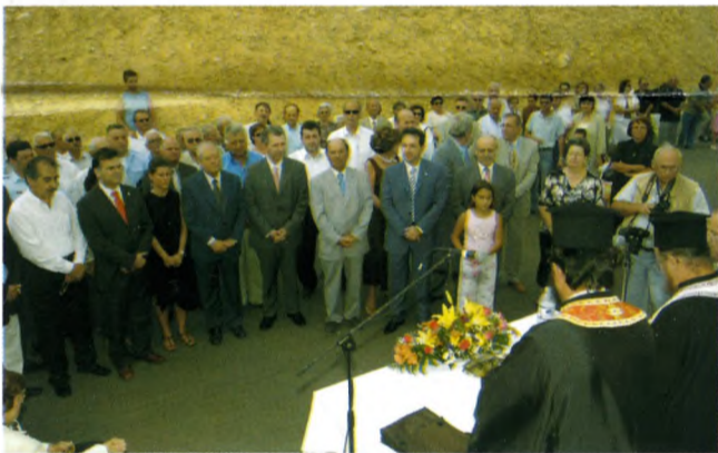
Αγιασμός του ΒΙΟΚΑ κατά την ημέρα των εγκαινίων.