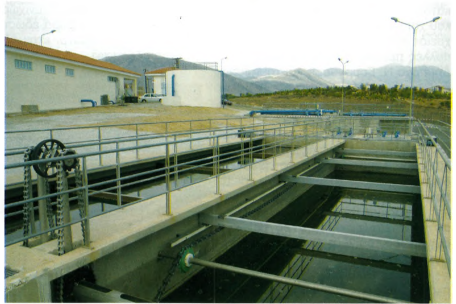
Οι εγκαταστάσεις του Βιολογικού Καθαρισμού Γαλαξειδίου την ημέρα των εγκαινίων.