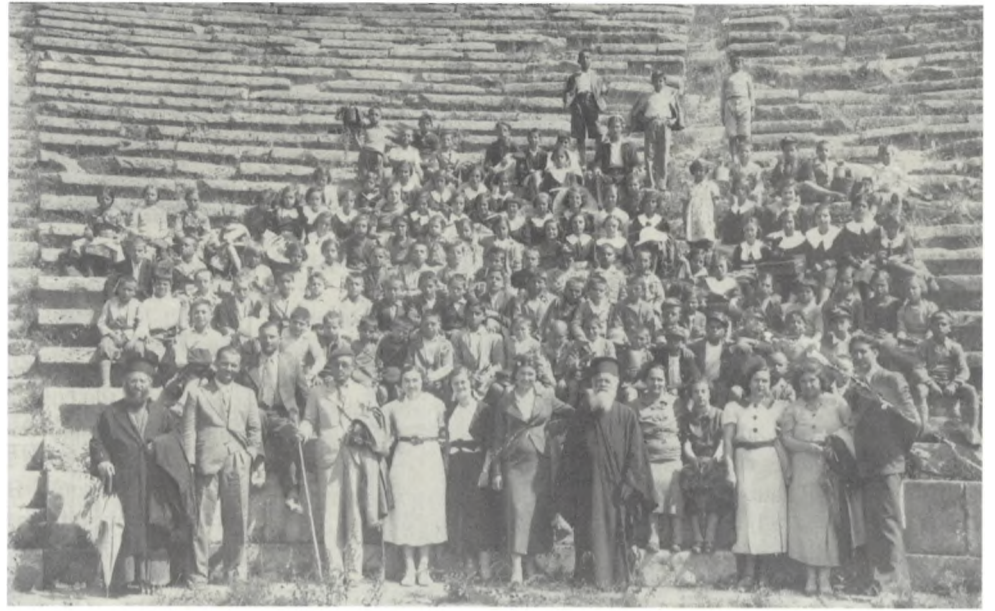
“Ενθύμιον εδρομής εις Δελφούς του Δημ. Σχολείου Γαλαξειδίου την 29/5/37”.