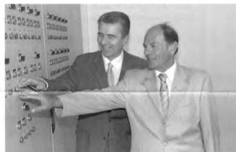
Η στιγμή έναρξης λειτουργίας του ΒΙΟΚΑ.