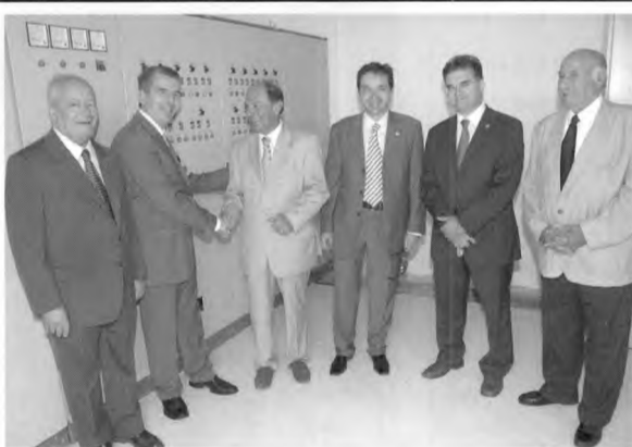
Οι φωτογραφίες από τα εγκαίνια του ΒΙΟΚΑ είναι του Ηλία Μασσάρου.