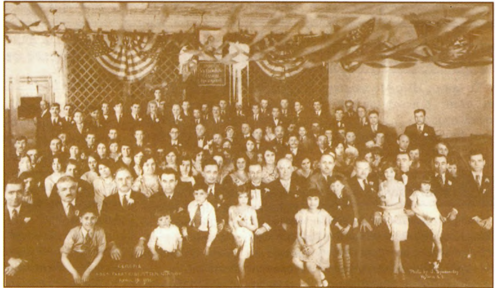
Τα μέλη με τις οικογένειές τους του γαλαξειδιώτικου σωματείου της Αμερικής «Οιάνθη» σε αναμνηστική φωτογραφία από την εορτασία της 19ης Απριλίου 1931.