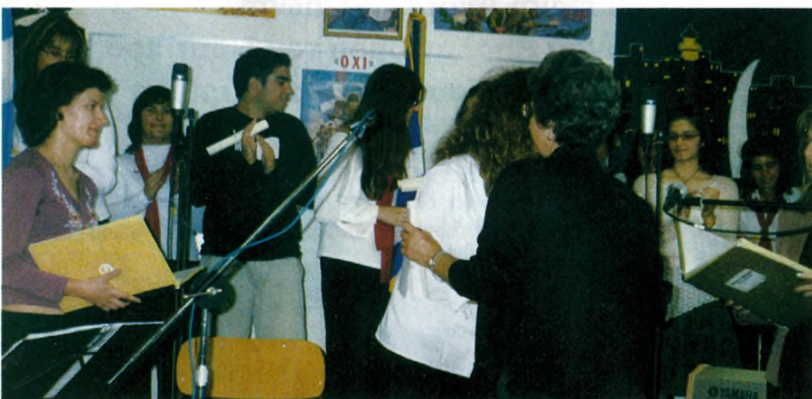
Από την τελετή βράβευσης στα σχολεία Γυμνάσιο - Λύκειο.