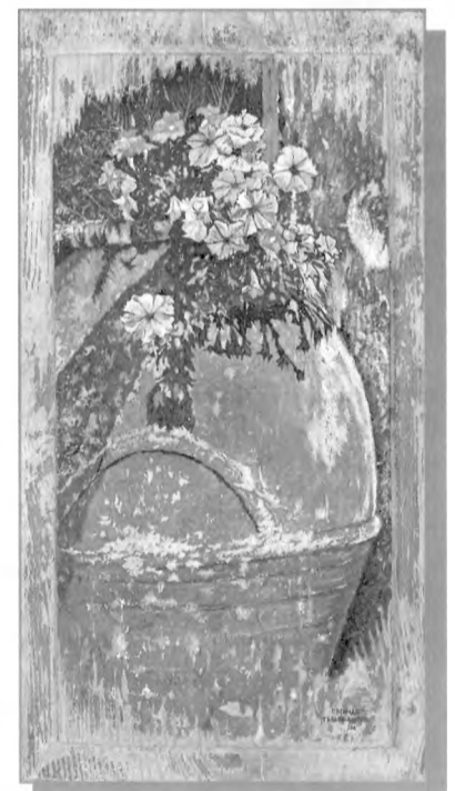
Έργο του Γ. Μηνά.

Η προσέλευση μεγάλη, από φιλότεχνο κοινό αλλά και από φίλους Γαλαξειδιώτες, που τίμησαν και θαύμασαν την όμορφη δουλειά του Γιώργου.