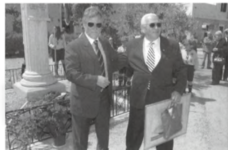
Ο Δήμαρχος Γαλαξειδίου με τον πρ. της ΠΕΣΠΕΝ

Ο πρόεδρος, το Δ.Σ. και τα μέλη του Συνδέσμου Συνταξιούχων ΝΑΤ Γαλαξειδίου