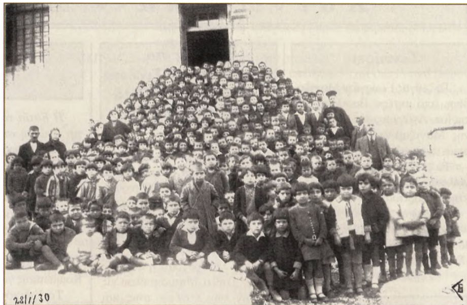
28η Ιανουαρίον 1930 όταν το Δημοτικό Σχολείο Γαλαξειδίου αριθμούσε 320 παιδιά.