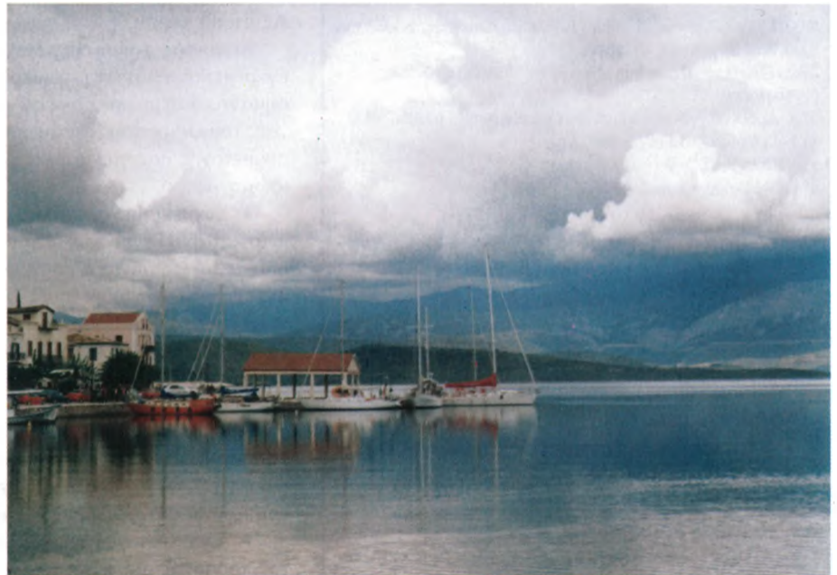
Γαλαξειδί - Το κεντρικό λιμάνι