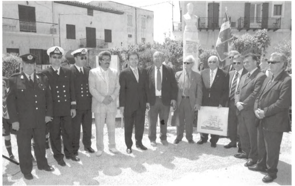
Ο δήμαρχος Γαλαξειδίου, ο νομάρχης και βουλευτής Φωκίδας, Σύνδεσμος συντ. Ν.Α.Τ. Γαλαξειδίου, τοπικοί παράγοντες, Λιμενικές Αρχές, το Δ.Σ. της ΠΕΣΠΕΝ στον ανδριάντα του Γεράσιμου Ζωχίου ιδρυτή του Ναυτικού Απομαχικού Ταμείου

Τους δύο ιερείς του Ναού Αγίου Νικολάου, που ανέλαβαν το ιερό μέρος της δεήσεως και το τρισάγιο προ του αδριάντου,