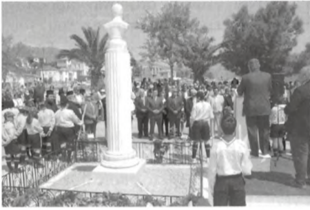
Επιμνημόσυνη δέηση στο άγαλμα του Γεράσιμου Ζωχίου στο Χηρόλακα.

Στις 28/04/07 ημέρα Σάββατο, πρωί χαράξαμε πορεία (ρότα) για να επισκεφθούμε την ιστορική στα ναυτικά χρονικά, ναυτομάνα πόλη της Φωκίδας, το περίφημο και ιστορικό Γαλαξειδί, με ένα μεγάλο ναυτικό όνομα γνωστό στα πέρατα της οικουμένης, ως τον τόπο με την αρχαιότερη ναυτική ιστορία, τον τόπο που κατείχε τον μεγαλύτερο στόλο ιστιοφόρων σκαφών, τον τόπο που κατασκεύαζε τα πιο όμορφα σκαριά που διέσχισαν όλες τις θάλασσες απ' άκρο - σ' άκρο του κόσμου, και χαιρόσουν να τα καμαρώνεις με πλήρη ιστιοφορία να σχίζουν τα κύματα του πελάου. Θα μπορούσε κανείς για το Γαλαξειδί να μιλάει με τις ώρες, αλλά προέχει το γεγονός αυτή τη στιγμή