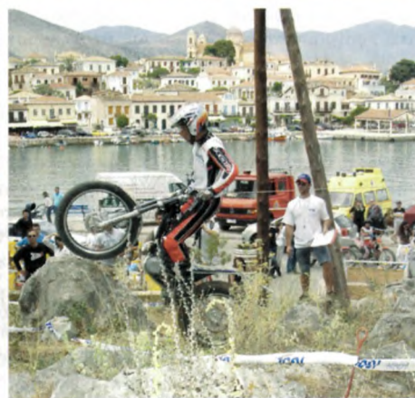
Στιγμιότυπα από το Πανελλήνιο Πρωτάθλημα Moto Tzial στο Γαλαξειδί.