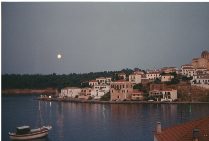
Μερική άποψη του Γαλαξειδίου από το λιμάνι του Χηρόλακα με πανσέληνο.