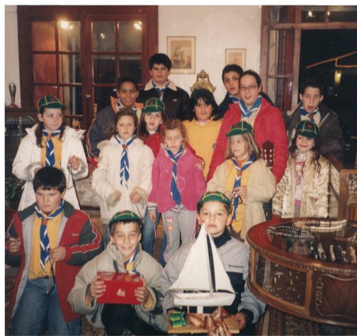
Από τα ναυτοπροσκοπάκια τα κάλαντα σε Γαλαξειδιώτικο σπίτι.

Η μοναδική πλήρης επιχειρηματική βιογραφία του μεγάλου Έλληνα εφοπλιστή. Δίγλωσση έκδοση (ελληνικά - αγγλικά) 372 σελίδες, περισσότερες από 550 απεικονίσεις, συμπεριλαμβανομένων όλων των πλοίων που κατασκευάστηκαν για λογαριασμό του ομίλου Ωνάση.