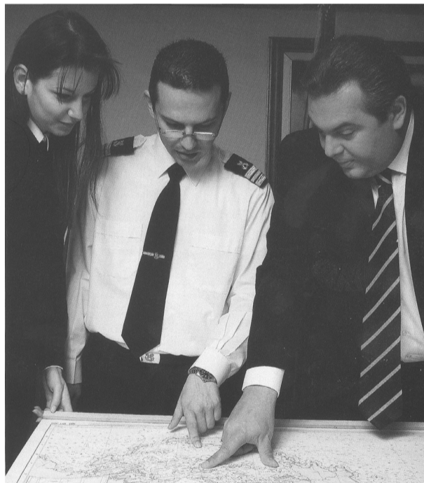
«Πηγαίνω δύο φορές την εβδομάδα στη Μυτιλήνη. Και δεν είμαι από εκείνους που πάνε με το αεροπλάνο ή με το ελικόπτερο. Μιλώ με τον κόσμο, όχι μόνο της Α' θέσης, αλλά και τον καταστρώματος».

Ακολουθως αναδημοσιεύουμε ένα ενδιαφέρον απόσπασμα από τη συνέντευξη του κ. Πάνου Καμμένου στον κ. Φώτη Μαργίνο του περιοδικού “ΕΦΟΠΛΙΣΤΗΣ”.