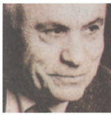
Του Πέτρου Θέμελη

Δεν διατηρούμε δυστυχώς καλές σχέσεις με τα ποτάμια μας. Τους πετάμε σκουπίδια και κάθε είδους απορρίμματα, τα μπαζώνουμε και φρτεύουμε από πάνω σπίτια αντί για δέντρα. Τα εγκλωβίζουμε σε μπετονένια κανάλια, τα μετατρέπουμε σε υπονόμους βρωμερούς και τελικά σε μονίμως μπιτολιανομένους αυτοκινητόδρομους. Γνωστή η μοίρα των δύο φημισμένων ποταμών της Αττικής με τα πανάρχαια προελληνικά ονόματά τους, του Ιλισού και του Κηφισού. Θρηνώ πρώτο τον Ιλισό.