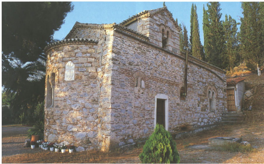
Η Ι. Μονή Μεταμόρφωσης Σωτήρος.

Ακολουθεί το έγγραφο Νομαρχιακής Αυτοδιοίκησης Φωκίδας και η μελέτη της εταιρείας “Τεχνική-Αναστηλωτική-Βιοκλιματική-Engineering Consulting”.