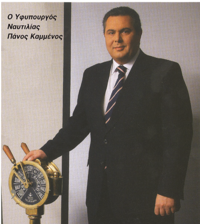
Ο Υφυπουργός Ναυτιλίας Πάνος Καμμένος