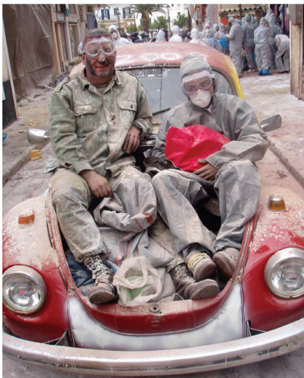
Τα άρματα ετοιμάζονται να κατέβουν στην παραλία.