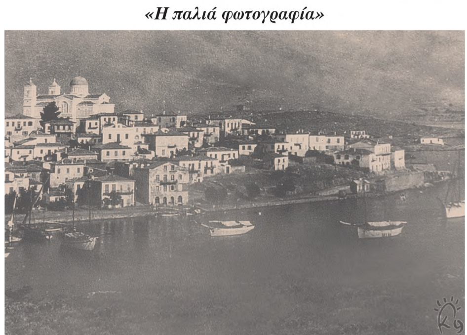
Σπάνια φωτογραφία με πολλά καράβια στο λιμάνι του Γαλαξειδιού, στις αρχές του 1920.

Ευχαριστούμε τον Κώστα Κωστάκο για τη συνεργασία και τη συμβολή του στην παρέλαση των αρμάτων που διοργάνωσαν οι νέοι του τόπου μας την Κυριακή το βράδυ κα-