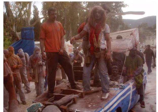
Οι φωτογραφίες είναι του φωτογράφου Ηλία Μασσάρου. Τον ευχαριστούμε θετικά.