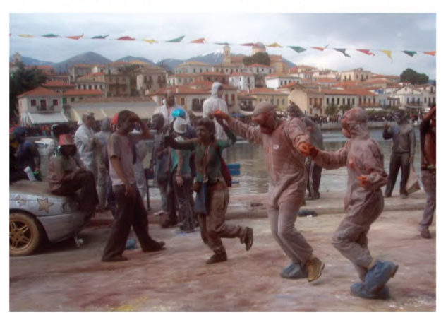
Στιγμιότυπα από το αποκριάτικο ξεφάντωμα και το αλευρομουντζουρώμα της Καθαράς Δευτέρας.