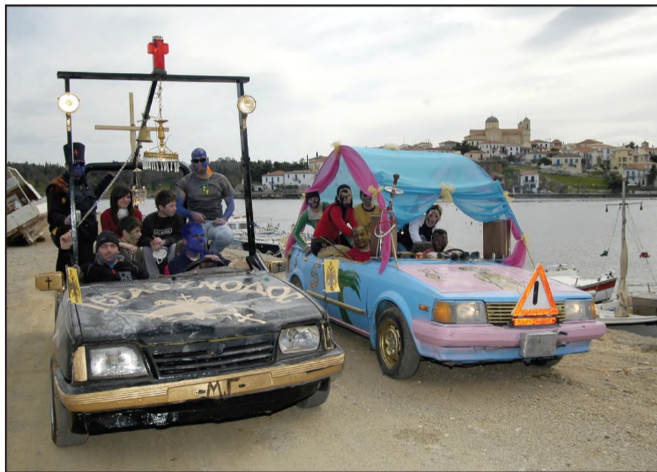
Κούλουμα στο Γαλαξείδι

Το έθιμο καλά κρατεί. Και κάθε χρόνο είναι και μεγαλύτερη η συμμετοχή των επισκεπτών που βιώνουν το αλεδρομοντζούρωμα μαζί με τους Γαλαξειδιώτες.