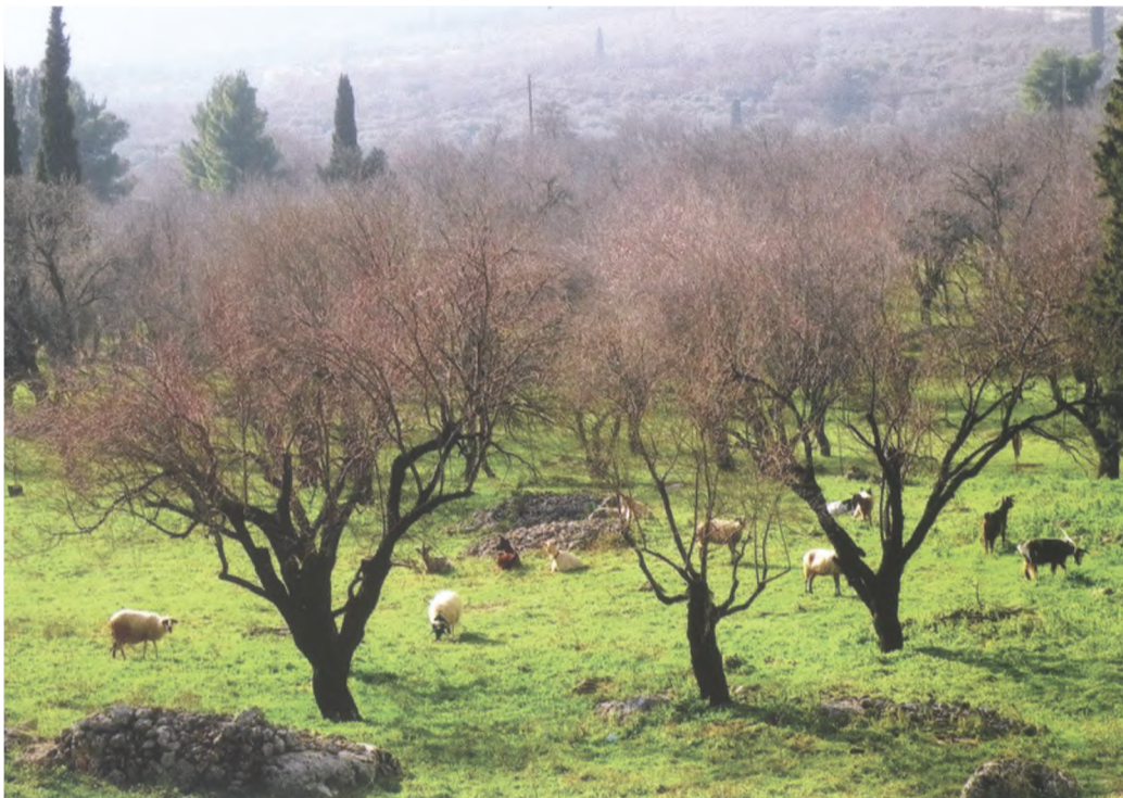
Στιγμιότυπο στην παγωμένη καρδιά του χειμώνα. Ο αένας κύκλος συνεχίζεται... (Από το ημερολόγιο 2012 του Συλλόγου Αγιοευθυμιωτών «Ο Άγιος Ευθύμιος»)

Από το Δήμο Δελφών οι δημότες Γαλαξειδίου περιμένουν μια δίκαιη και ειλικρινή απόφαση.