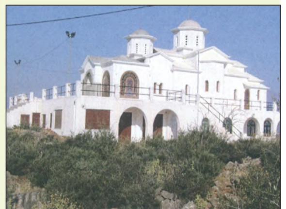
Το κτηριακό συγκρότημα του Ιερού Καθιδρύματος