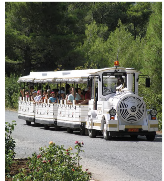
Το τρενάκι που είχε υποσχεθεί προεκλογικά ο Δήμαρχος Δελφών για το Γαλαξειδί.