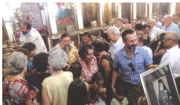
Στυγμιότυπο από την τέλεση του αρχιερατικού μνημοσύνου του μακαριστού ιεράρχη Ιακώβου στον Ι.Ν. της Αγίας Παρασκευής.

Στο επίμετρο ο ποιητής, με ιδιαίτερη συστολή και σεβασμό προς τον αναγνώστη, αφήνει να φανερωθεί το μεγαλείο που τον ενέπνευσε για το έργο αυτό.