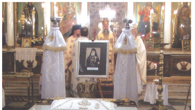
Από την τέλεση του αρχιερατικού μνημοσύνου του μακαριστού ιεράρχη Ιακώβου στον Ι.Ν. της Αγίας Παρασκευής.

Στο ποίημα « Αγώνας » παρουσιάζεται ο τρόπος εισόδου