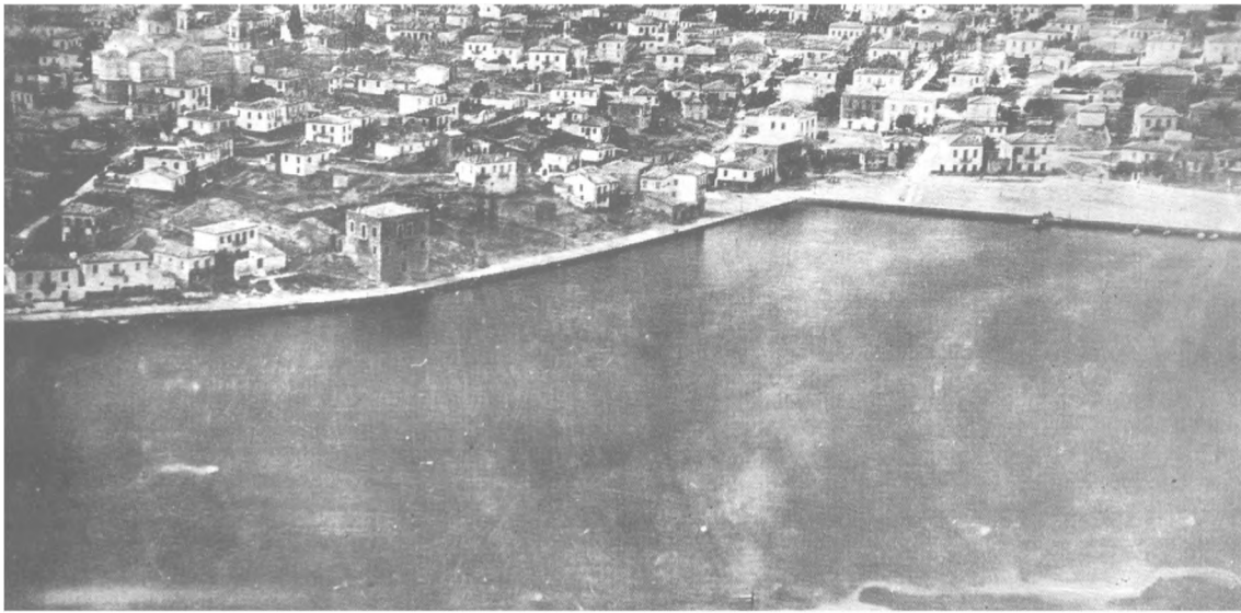
Το παλιό λιμάνι του Χηρόλακα. Αεροφωτογραφία του 1926.