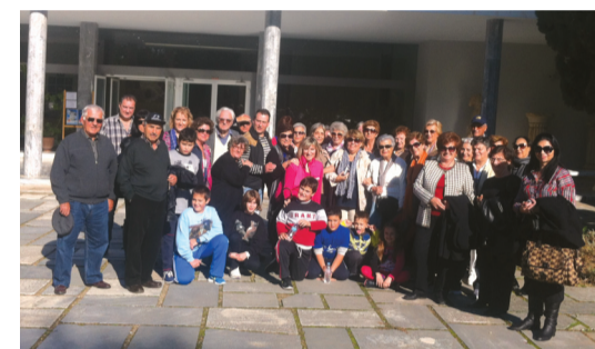
Αρχαία Ολυμπία 24-11-2012.