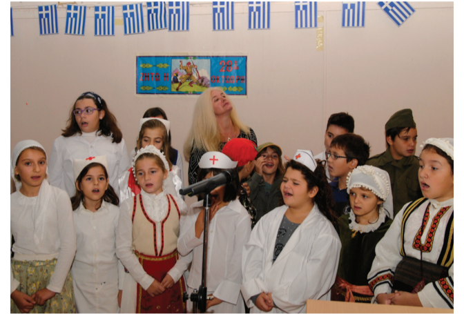
Σκηνές από την γιορτή του Δημοτικού την 28 Οκτωβρίου.

της μουσικής, προς τιμήν της αφιλοκερδώς, για τις ανάγκες του Συλλόγου.