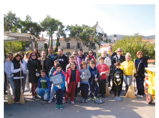
Τη δράση που οργάνωσε ο Δήμος Δελφών στα πλαίσια εθελοντικής καθαρότητας την 1 Νοέμβρη, στήριξαν οι τοπικοί σύλλογοι.