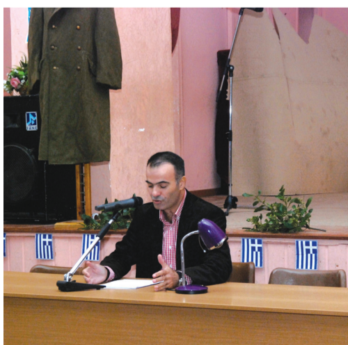
Ο πρόεδρος του Πολιτιστικού Συλλόγου στην εκδήλωση του Συλλόγου για την 28η Οκτωβρίου