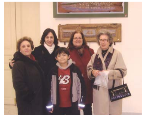
Από την παρουσία του Δ.Σ. του Συνδέσμου Γαλαξειδιωτών στα εγκαίνια της έκθεσης.