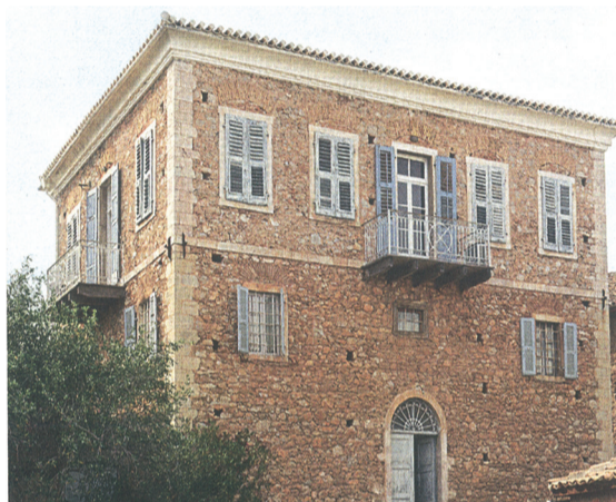
Εξωτερική άποψη ενός από τα παλιά αρχοντικά της πόλης.

Αποκομμένοι από τον στερεοελλαδίτικο κορμο έως το 1950, οι Γαλαξειδιώτες στράφηκαν ήδη από τον 18ο αιώνα στη θάλασσα. Το 1860 το Γαλαξίδι αριθμούσε πάνω από 300 πλοία, ενώ τη δεκαετία του 1870 ήταν το δεύτερο ναυτιλιακό κέντρο της Ελλάδας, με 130 οικογένειες παραβοκύρηδων, ναυπηγεία, αλληλοασφαλιστικές εταιρείες, τραπεζικά "καταστήματα" και κοσμοπολίτικο κλίμα. Για να φτάσει εκεί, χρειάστηκε να ξεπεράσει τις απώλειες που είχε στην Επανάσταση του 1821, όταν οι Τούρκοι κατέστρεψαν 40 από τα 70 πλοία του και το έκαψαν τρεις φορές. Ωστόσο, δεν κατάφερε να "αλλάξει σελίδα", όταν ο ατμός αντικατέστησε τα ιστία κι έτσι στις αρχές του 20ού αιώνα τα ιστιοφόρα του έπαψαν να διασχίζουν τη Μεσόγειο. Η εποχή της ναυτικής ακμής, των Αρβανίτηδων, των Βισβίκηδων, των Δεδούσηδων, των Κατσούληδων, των Μητρόπουλων και αρκετών άλλων, παραμένει ζωντανή στο γραφικό Γαλαξίδι. Τη θυμίζουν τα αρχοντικά με τα ευρωπαϊκά στοιχεία, η μεγάλη άγκυρα στο λιμάνι του Χηρόλακκα, τα αγάλματα της γυναίκας του ναυτικού με τα παιδιά και του Γαλαξειδιώτη καπετάνιου με το πηδάλιο, το υπέροχο Ναυτικό και Ιστορικό Μουσείο, με τις 140 υδατογραφίες γαλαξειδιώτικων ιστιοφόρων.