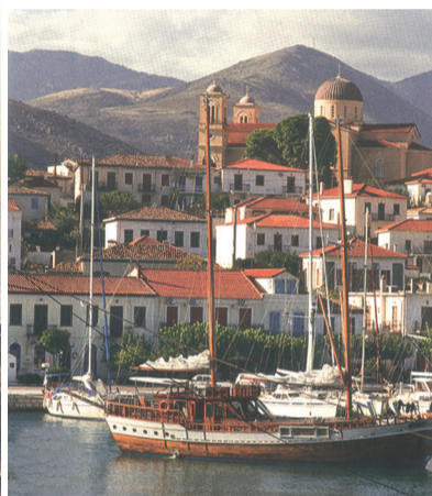
Την εποχή των πανιών, Σύρος και Γαλαξίδι υπήρξαν τα πιο σημαντικά ναυτικά κέντρα της Ελλάδας.