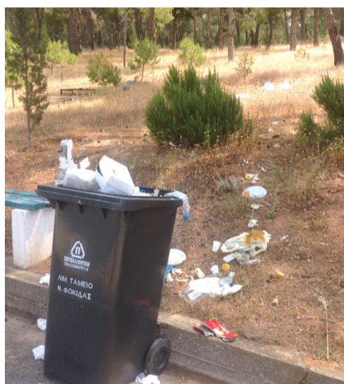
Δευτέρα του Πάσχα, 2 Μαΐου: Αυτή για τους επισκέπτες του Γαλαξειδίου θεωρείται η Διονυσίου Αρεοπαγίτου. Από τη μία μεριά η θάλασσα από την άλλη το δελφικό τοπίο και το ιερό βουνό της αρχαιότητας.