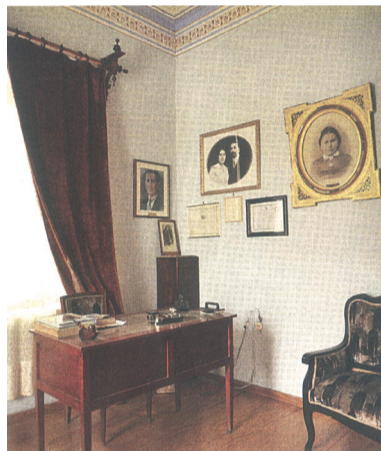
Η διακόσμηση των αρχοντικών περιλάμβανε διαλεχτά αντικείμενα που έφερναν οι καπεταναίοι από τις αγορές του εξωτερικού.