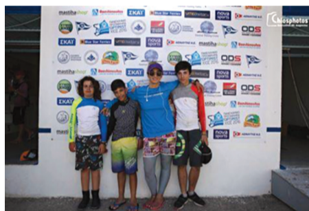
Πανελλήνιο Πρωτάθλημα Optimist - Χίος

Συγχαρητήρια σε όλα τα παιδιά μας για την εκπροσώπηση της πόλης μας σε αυτές τις μεγάλες αθλητικές διοργανώσεις, για την προσπάθεια και τις επιδόσεις τους, καθώς και στην προπονήτριά μας για το έργο της και τους συνοδούς για την βοήθειά τους.