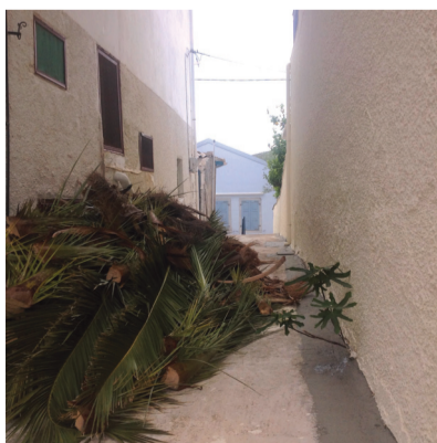
Μεγάλη Παρασκευή 29 Απριλίου: Κλαδεύτηκαν τα δέντρα και όμως εκεί έως την Πέμπτη της Λαμπρής!!!