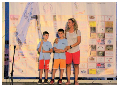
Πανελλήνιο Κύπελλο Optimist 11 χρόνων - Καλαμάτα

σκάφους, το οποίο έχει παραμείνει πολλά χρόνια εκτός θάλασσας.