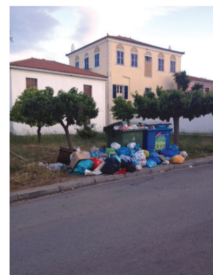
Πέμπτη του Πάσχα, 5 Μαΐου: Το Γαλαξίδι μετά την Ανάσταση του Κυρίου!!!

Κατά τα άλλα ο τουρισμός είναι η βαριά βιομηχανία της χώρας.