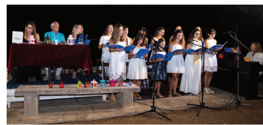
Συμμετοχή εφηβικής χορωδίας.

Στην έκδοση αυτή συμπεριλαμβάνονται και κάποια αποσπάσματα από το βιβλίο «Γάλαξα, Σκίτσα και μνήμες» που έχει γράψει ο αείμνηστος Γιώργος Τσαουσάκης, του οποίου η προσφορά υπήρξε πολύτιμη, τόσο για τον τόπο όπου γεννήθηκε, όσο και για