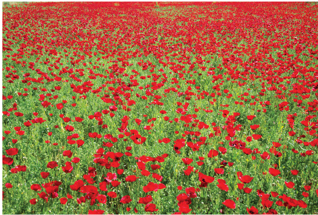
Οι παπαρούνες άνθισαν και φέτος.

«Ελάτε στον ανθόκηπο και κόψτε / γαλήνη, καλοσύνη απ' τη γη, αγνό μπουκέτο την καρδιά σας δώστε / στου Μάη τη χαρούμενη αγή».