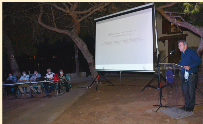
Χαιρετισμός από τον Αντιπεριφερειάρχη Π.Ε. Φωκίδας κ. Γ. Δελμούζο.

διάταξη και τις κατευθύνσεις, τον ανασχεδιασμό της χερσαίας ζώνης και τις πιθανές επεκτάσεις της, τις αρχιτεκτονικές λύσεις για τη νομιμοποίηση των κατασκευών μπροστά από τα καταστήματα εντός χερσαίας ζώνης, τις προτεινόμενες περιοχές για δημιουργία χώρων στάθμευσης, τις προτεινόμενες παρεμβάσεις στο θαλάσσιο μέτωπο, τις ήδη χρηματοδοτούμενες μελέτες που άμεσα θα δημοπρατηθούν και θα εκπονηθούν, ενώ έγινε ενημέρωση για τα έργα που είναι σε εξέλιξη, αυτά που αναμένουμε σύντομα να ξεκινήσουν και αυτά που ευρίσκονται σε φάση σύσταξης μελέτης και 'ωρίμανσης.' Στο τέλος της παρουσίασης έγιναν ερωτήσεις οι οποίες και απαντήθηκαν.