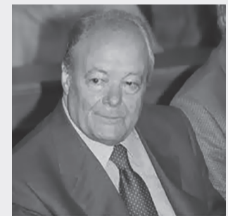
Νικόλαος Γκελεστάθης 1930-2020