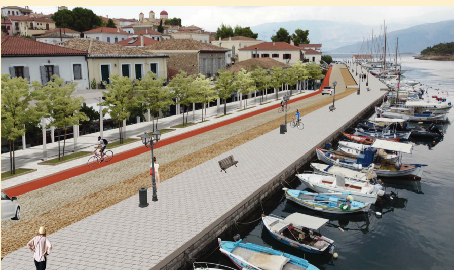
πρόταση διαμόρφωσης χώρου ανάπτυξης τραπεζοκαθισμάτων ανάπλαση χερσαίας και θαλάσσιας ζώνης λιμένων Γαλαξειδίου