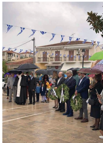
Κατάθεση στεφάνων από τις δημοτικές αρχές

Χωρίς παρελάσεις εορτάστηκε φέτος η επέτειος τής 28ης Οκτωβρίου 1940 με σχετική εγκύκλιο τού Υπουργείου Εσωτερικών η οποία ανέφερε την αναστολή τής διενέργειας των πάσης φύσεως παρελάσεων κατά την εθνική εορτή τής 28ης Οκτωβρίου κατά το έτος 2020 σε όλη την Επικράτεια,