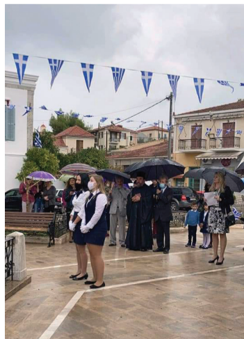
Κατάθεση στεφάνων από αντιπροσωπίες μαθητών των σχολείων