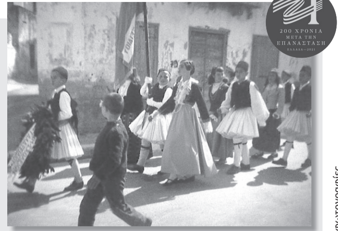
Εικόνα από το παρελθόν. Παρέλαση στο Γαλαξίδι την 25η Μαρτίου, δεκαετία του '60. Τα αγόρια με τη φουστανέλα και το φέσι και τα κορίτσια με παραδοσιακή στολή.

Πρόεδρος Επιτροπής Ελληνικής Γλώσσας και Πολιτισμού τής Ελληνορθόδοξης Μητρόπολης Ντιτρόιτ