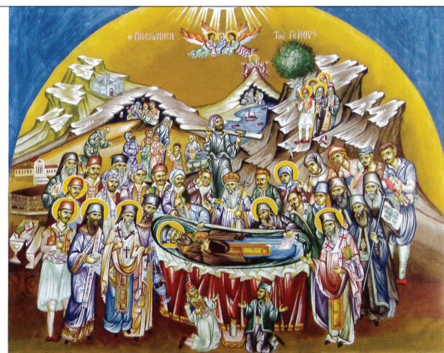
Η προσκύνηση του Γένους, έργο Αρχμ. Αμφιλοχίου Καμίση, παρεκκλήσιο αγίου Κοσμά, Ιερά Μονή Κοιμήσεως τής Θεοτόκου Προσήλου.

Στρατηγού Μακρυγιάννη. «Απομνημονεύματα». Εκδ. Ε.Γ. Βαγιωνάκη, Αθήνα, 1947, σσ. 161-162