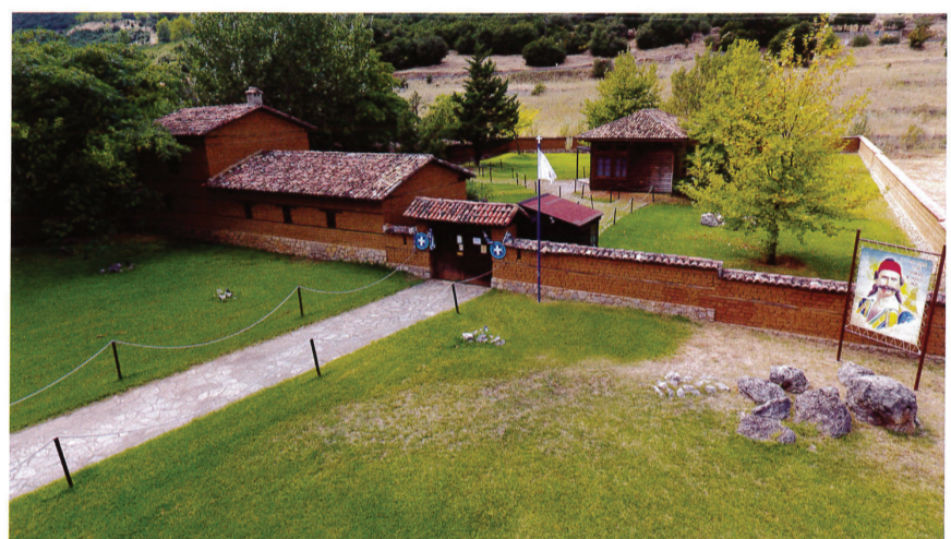
Το Χάνι της Γραβιάς.

Ήταν ό Όμηρ Βεργιόνης κι άλλοι πασάδες, δλο διαλεμένο και πολύ άσκερι. Και είς τό χάνι τής Γραβιάς εκλείστη ό Δυσσέας, ό καχός πατριώτης, κι ό Γκούρας κι άλλοι και πολέμησαν μ' αύτεϊνη τήν μεγάλη δύναμιν εκατό ανθρώποι. Και φαίνονται ως τήν σημερον οι τάφοι τών Τούρκων εκεί είς τό χάνι. Και τούς αφάνισαν, και τούς χάλασαν όλα τους τά σχέδια. Και γλύτωσε ό κόσμος, όπου θά σκλάβωναν αύτεϊνοι τούς περισσότερους και μπορούσε να κινυνέψη κι όλη ή πατρίς. Ρούμελη και Πελοπόννησο (ότ' ήταν αυτά τά πρώτα κινήματα), αν προχωρούσανε μέσα και να βγαζων και τούς πολιορκημένους Τούρκους.