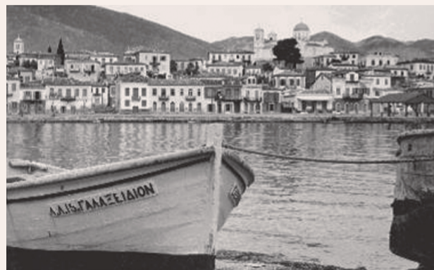
Γαλαξίδι, η αγορά από την πέρα πάντα 1950.