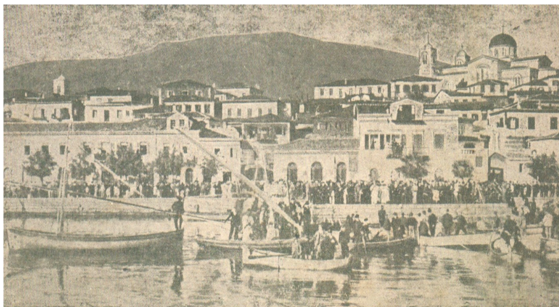
Θεοφάνια στην παραλία τού Γαλαξειδιού το 1917.

Τώρα, πώς γινόταν και τυχερός κάθε χρόνο έβγαίνε ο Θύμιος ο Παπάρας, ίσως νάτανε ο πιο δυνατός, ίσως νάτανε θέλημα Κυρίου. Ετούτος έπιανε θέση ψηλά στην αντένα τού καϊκιού, που καμάρωνε καταμεσίς στη θάλασσα. Είταν ένα παλικάρι απηλό ίσαμε