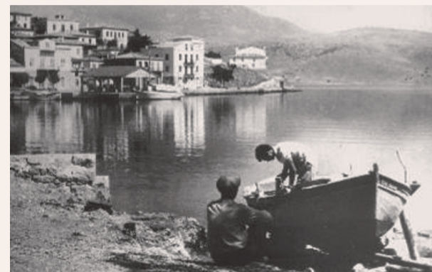
Γαλαξίδι, λιμάνι 1956.