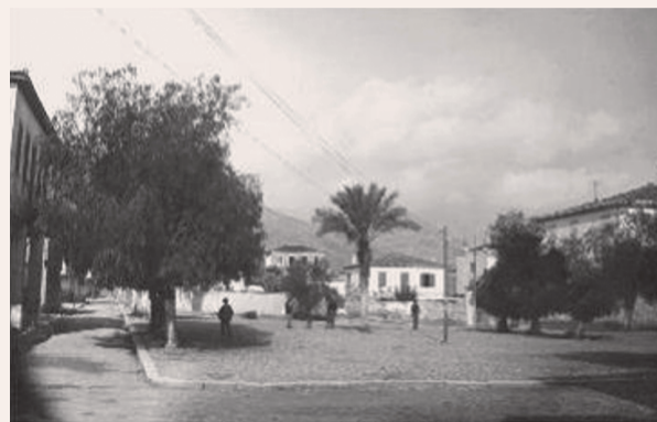
Γαλαξίδι, Παλαιοπάζαρο 1928.

Χειμώνας. Έξω χιονίζει, φυσάει ο παγωμένος βοριάς. Μόνο ο κορωνοϊός κυκλοφορεί! Καθισμένοι δίπλα στο τζάκι πήραμε το άλμπουμ με τις παλιές φωτογραφίες. Τι καλύτερο από το παλιό και πάντα όμορφο Γαλαξίδι!