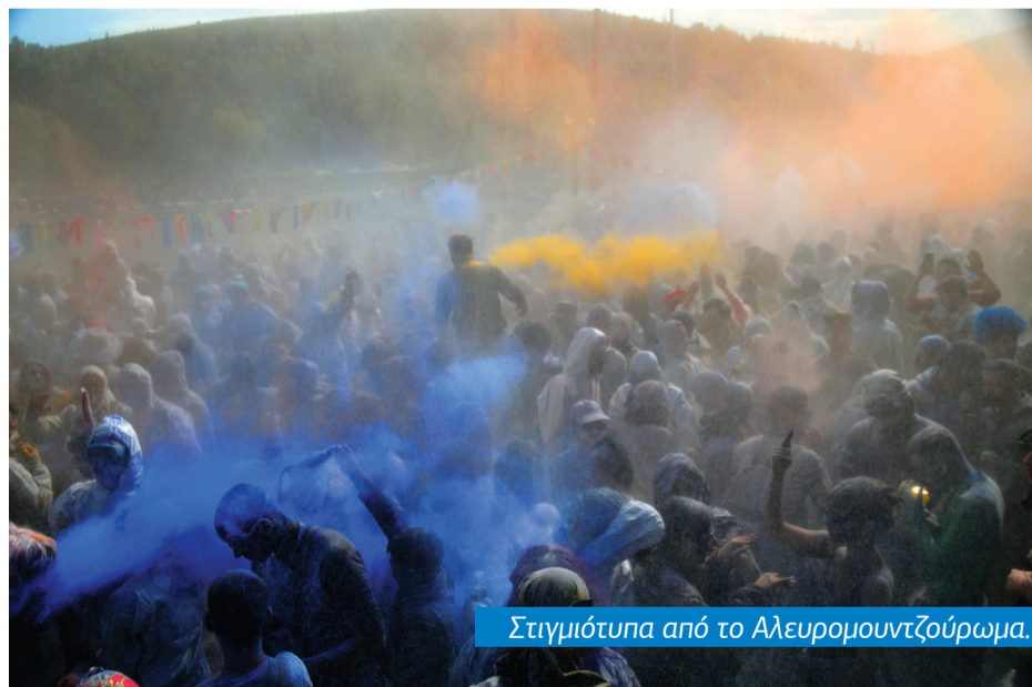
Στιγμιότυπα από το Αλευρομουντζούρωμα.

Έφθασε και η Καθαρή Δευτέρα. Κύλησε όπως συνηθίζεται με λαγάνες και αετούς. Το μεσημέρι, βέβαια, κάποιες κινήσεις έδειχναν ότι το αλευρομουντζούρωμα δεν ήταν απόν. Δεν άργησαν συντροφίες νέων, μεγαλύτερων και επισκεπτών, με τα ανάλογα εφόδια, να κάνουν έναρξη τής τελετής τού εθίμου μας που επισφραγίζει το τέλος των Απόκρεω. Με προστατευτικές στολές, καπέλα, κουδούνια, γυα-