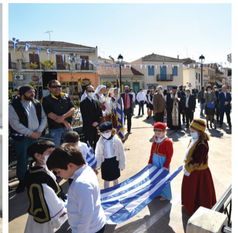
Τα παιδιά τού Δημοτικού με την ελληνική σημαία στην πλατεία Ηρώων.