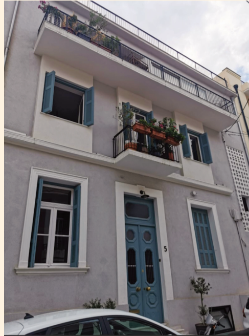
Το ιστορικό ακίνητο.

Πληροφορίες: 1. Αν Σκιαδά, το Γαλαξίδι, σσ. 234, 295. 2. Διαδίκτυο.