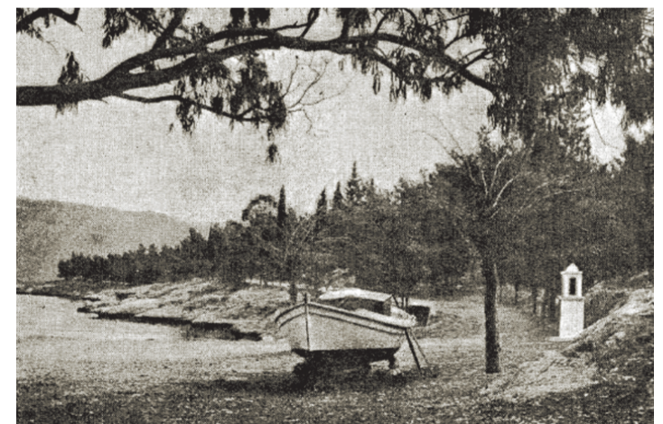
Η αρχή τού δρόμου τής Πέρα Πάντας