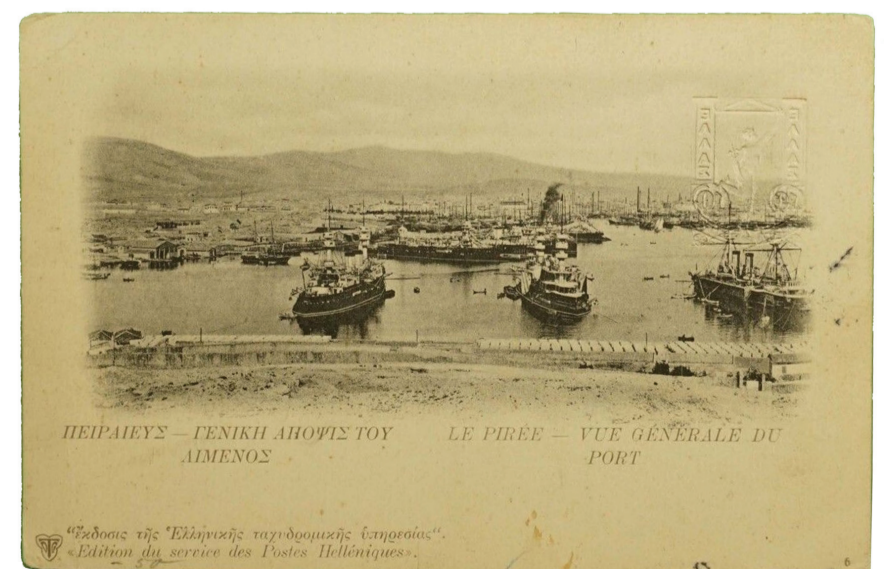
№ 6 ΠΕΙΡΑΙΕΥΣ ΑΠΟΦΙΣ ΛΙΜΕΝΟΣ