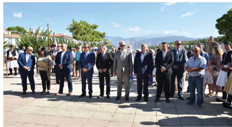
Κατάθεση στεφάνων στο μνημείο του Ι. Μητρόπουλου από τους εκπροσώπους της Δημοτικής και Πολιτικής ηγεσίας του τόπου.

Σημείωση της εφημερίδας: Ο Σύνδεσμος Γαλαξειδιωτών συμμετείχε κι αυτός ως χορηγός στην εκδήλωση, που πραγματοποιήθηκε για πέμπτη συνεχή χρονιά. Οι εκδηλώσεις αυτές αποτελούν ελάχιστο φόρο τιμής για τους προγόνους μας Γαλαξειδιώτες που έδωσαν τη ζωή και τις περιουσίες τους για την απελευθέρωση της Ελλάδας. Θυσίες που πρέπει να μας εμπνέουν και να αποτελούν ορόσημο στην ιστορική διαδρομή του Γαλαξειδίου. Συγχαρητήρια σε όλους τους συμμετέχοντες που μόχθησαν πραγματικά για την ωραία αυτή εκδήλωση.