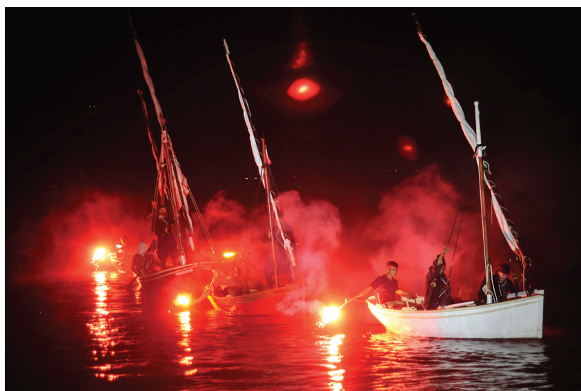
Φωτοβολίδες και δάδες φώτισαν φαντασμαγορικά το λιμάνι του Γαλαξειδίου το βράδυ της 17ης Σεπτεμβρίου.