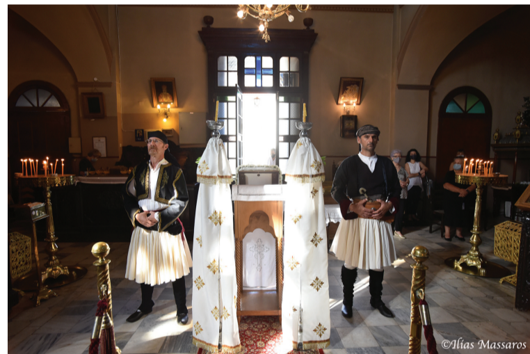
Από την επίσημη δοξολογία στον Ι. Ν. Αγίου Νικολάου.