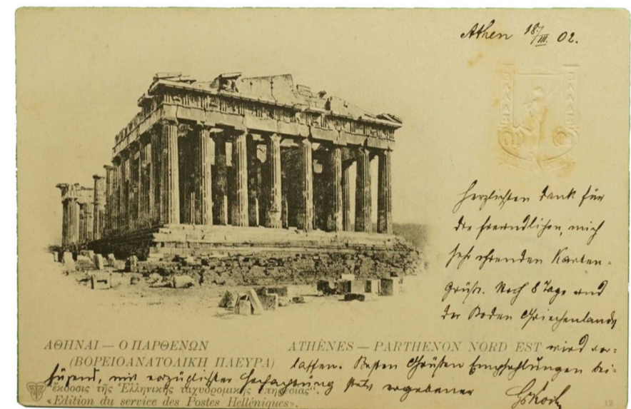
№ 12 ΠΑΡΘΕΝΩΝ